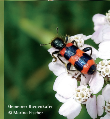
Gemeiner Bienenkäfer