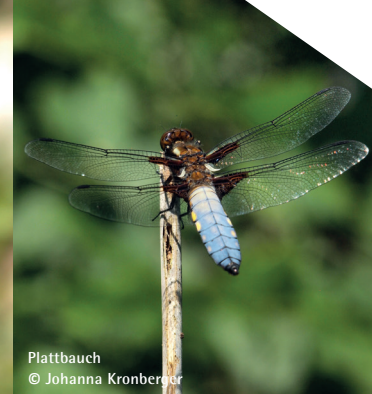
Plattbauch © Johanna Kronberger